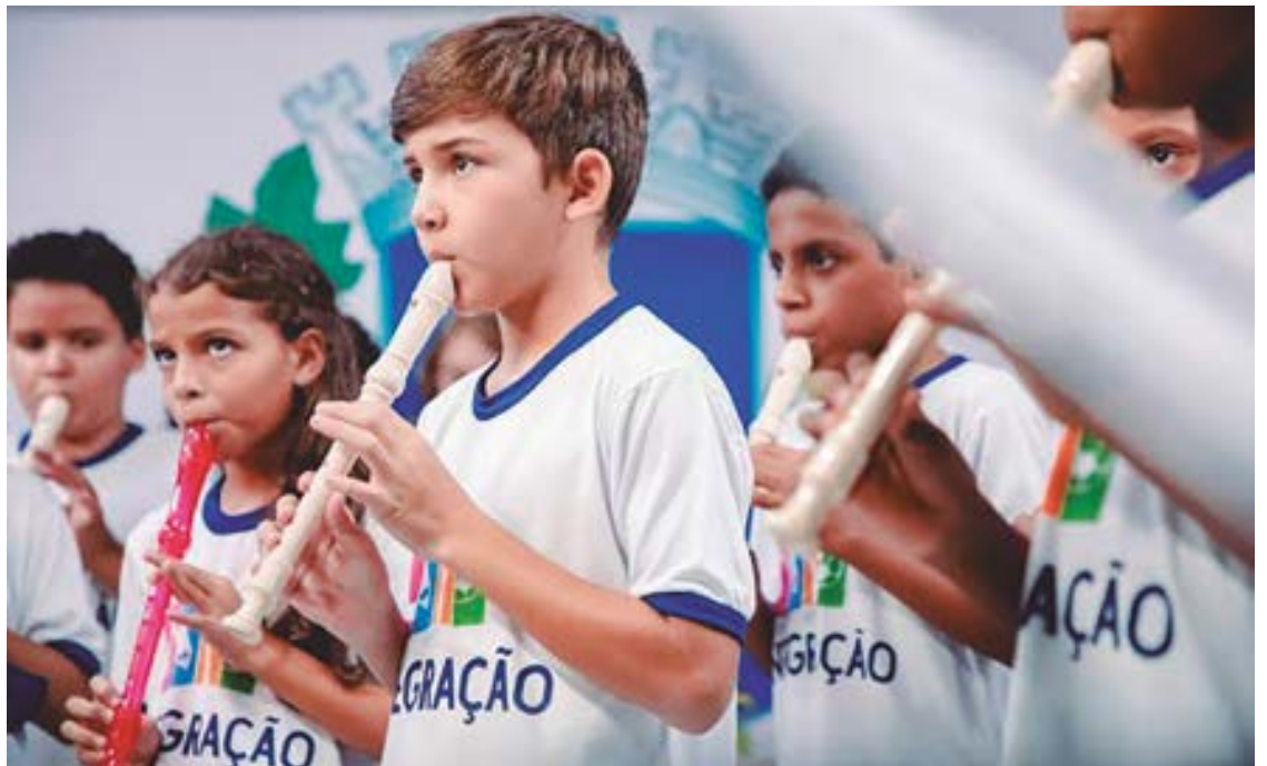
Acompanhamento integral às crianças é fundamental para protegê-las de situações que violem os seus direitos

Segundo Eerizania, a base do programa Integração é a garantia de direitos constitucionais às crianças, o que já vem rendendo bons frutos, com alguns integrantes já participando de apresentações culturais. Recentemente, um cantor mirim descoberto na Escola Municipal Ayrton Senna,