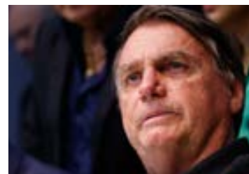
Jair Bolsonaro: inelegível para 2026, ex-presidente volta às ruas para denunciar perseguição política

“não mais cumpriria” medidas judiciais do ministro do STF Alexandre de Moraes. A declaração provocou forte represália entre autoridades, sobretudo do próprio Supremo, e forçou o então presidente a recuar no discurso contra a Corte.