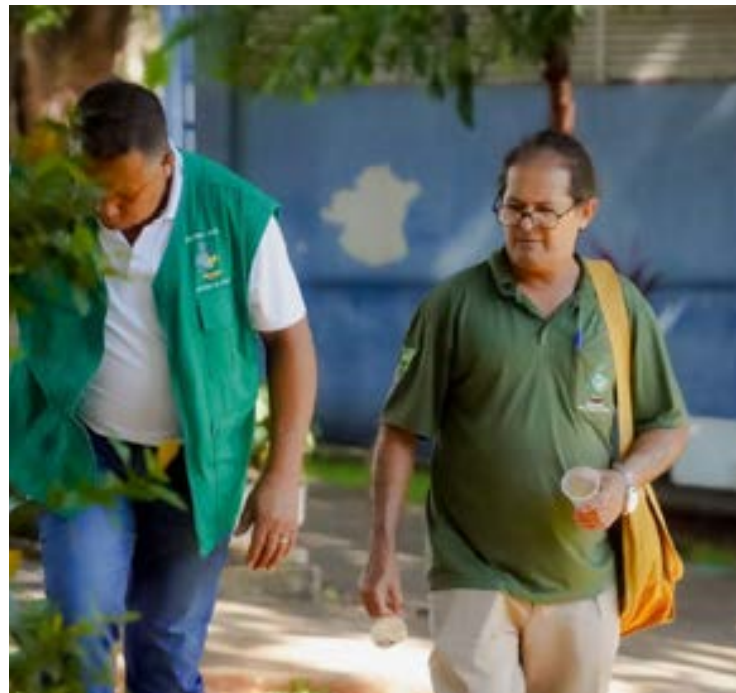
Secretaria Estadual de Saúde (SES) afirma que limpeza de quintais é fundamental para evitar casos de dengue