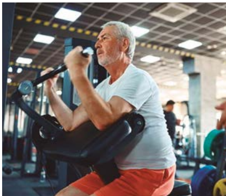
Dados apontam que apenas 24% dos cerca de 37 milhões de brasileiros acima dos 60 anos fazem algum tipo de atividade física de forma regular

Corroborada pelas recomendações do Ministério da Saúde, essa relação direta entre a qualidade de vida da pessoa idosa e