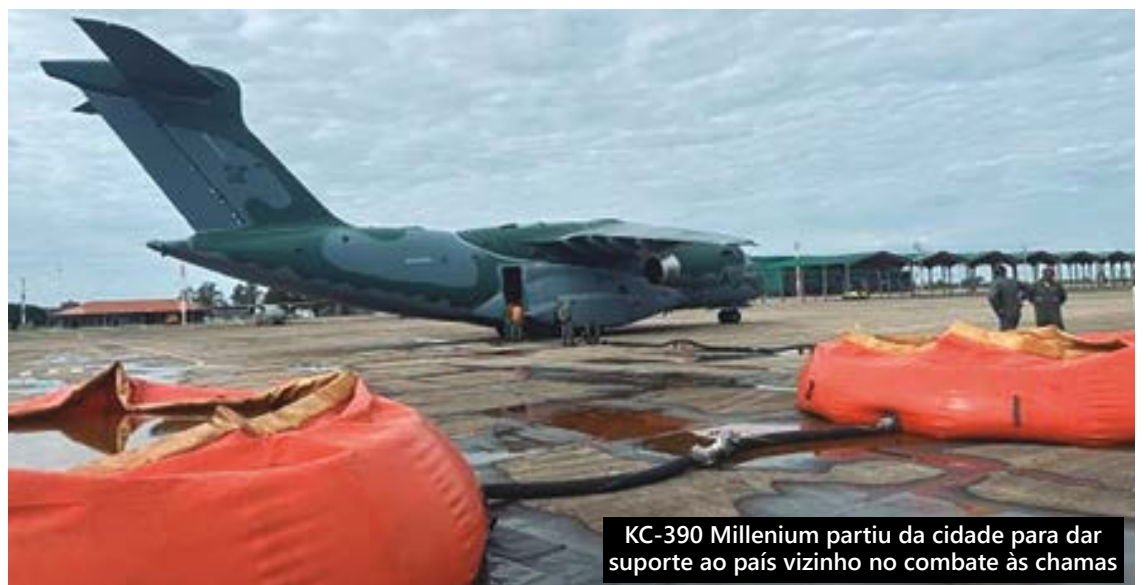
KC-390 Millenium partiu da cidade para dar suporte ao país vizinho no combate às chamas

Tenente-Coronel Umile Coelho Rende, ressalta a rapidez e eficiência na instalação do sistema,