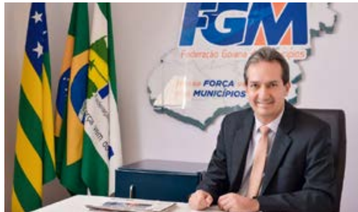
Haroldo Naves: prefeito busca recuperar receitas em 2024