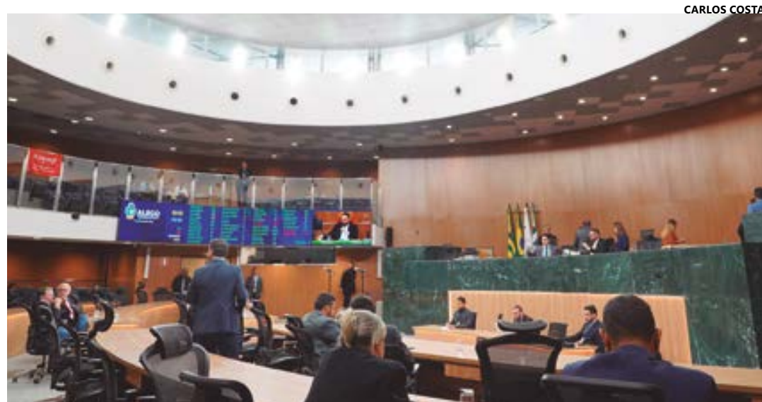
Abertura oficial dos trabalhos em 2024 está agendada para às 15 horas, em solenidade no plenário da Casa

área da educação, especialmente nos projetos do governo estadual voltados para reformas e construção de escolas. Mas ainda não anunciou quanto de suas emendas impositivas devem ser