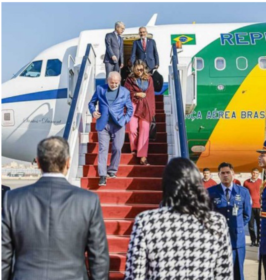
Lula e Janja a Silva na Cidade do Cairo (Egito) política bilateral na economia

Em outra ocasião, Lula também justificou que as viagens são para “recuperar a imagem” do País. “Era preciso recuperar a imagem do Brasil e construir uma imagem positiva do Brasil no mundo. O Brasil voltou a ter importância”, disse durante reunião ministerial em dezembro de 2023.