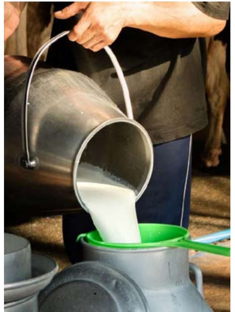
Já há alguns anos, o volume de leite produzido no Brasil está estagnado em 34 bilhões de litros anuais

“Mesmo com a desvalorização do leite nacional, já que atualmente se mantiveram motivados pela grande competitividade externa”, diz Carvalho. No fim do ano passado, o Governo Federal anunciou duas medidas para estimular a atividade