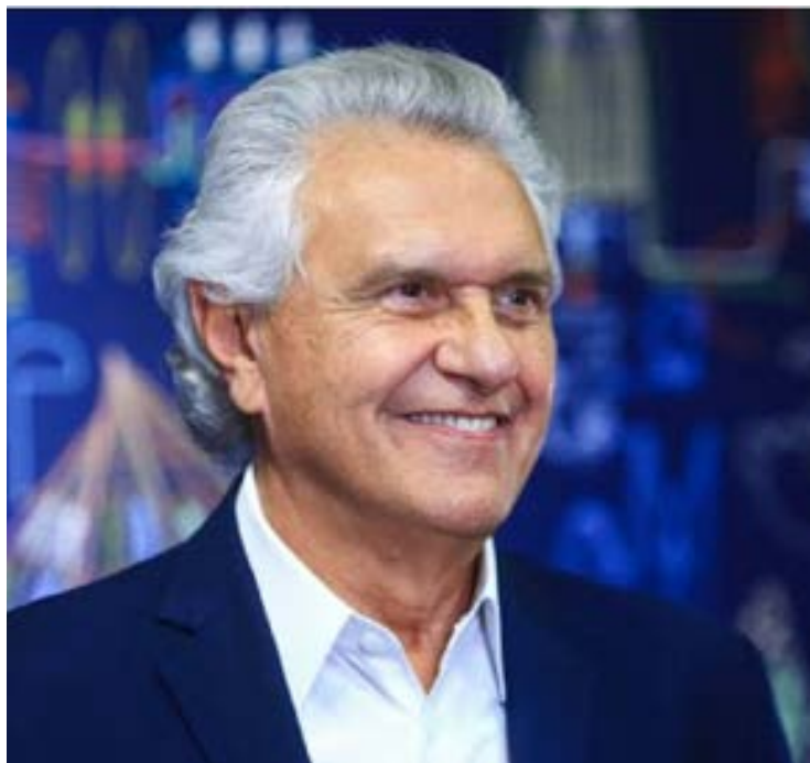
Ronaldo Caiado, que é médico, lidera vacinação contra a dengue nesta quinta-feira, em Aparecida de Goiânia

De acordo com o Governo de Goiás, o Estado recebeu 72.818 vacinas e concluiu a distribuição aos primeiros 51 municípios antes do feriado de Carnaval.